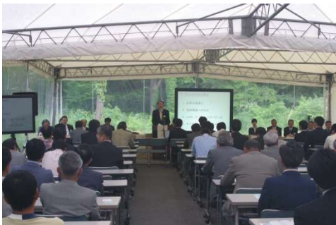
屋外特設テントで総会を開催していたことも ※現在は屋内会議室での開催です