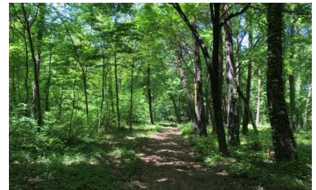
2017年5月、KOAパインパーク内某所にて撮影