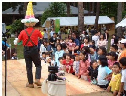
総会終了後に地域の皆様もお招きして感謝祭 ※現在は総会後ではなく、別日程で秋に開催